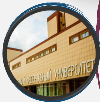
Сибирский федеральный университет