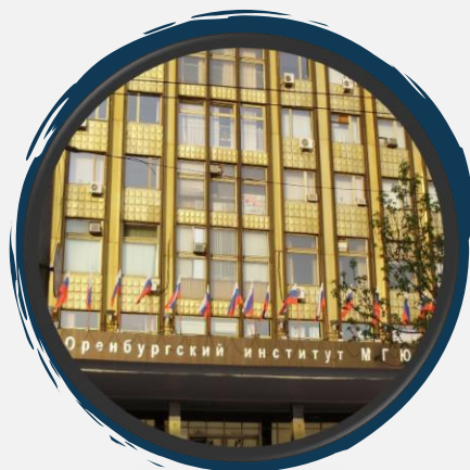
Оренбургский институт (филиал) Университета имени О.Е. Кутафина (МГЮА)

г. Москва, ул. Садовая-Кудринская, д. 9.