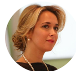
Директор Института бизнес-права К.Ю.Н