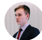
Зам. руководителя правового инкубатора