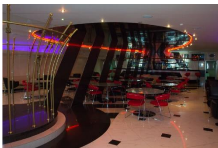
Развлекательный комплекс «O-ZONE»