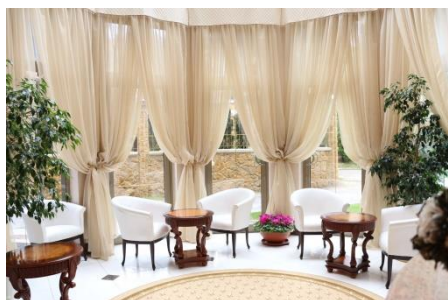
Лобби-бар «Dolce Vita»

Лобби-бар «Dolce Vita», развлекательный комплекс «O-ZONE», фито-бар, детская площадка, анимационная комната, развлекательные мероприятия, вечера караоке, экскурсии.