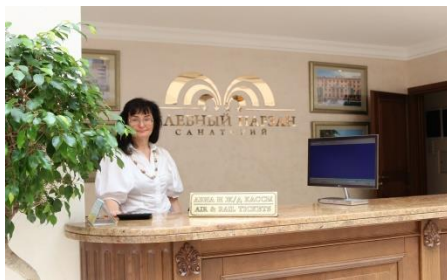
Авиа, ж/д касса