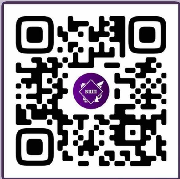
Высшая школа права