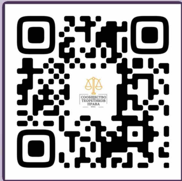
Сообщество теоретиков права