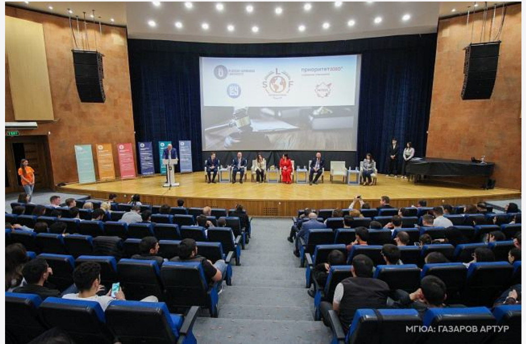
МГЮА: ГАЗАРОВ АРТУР